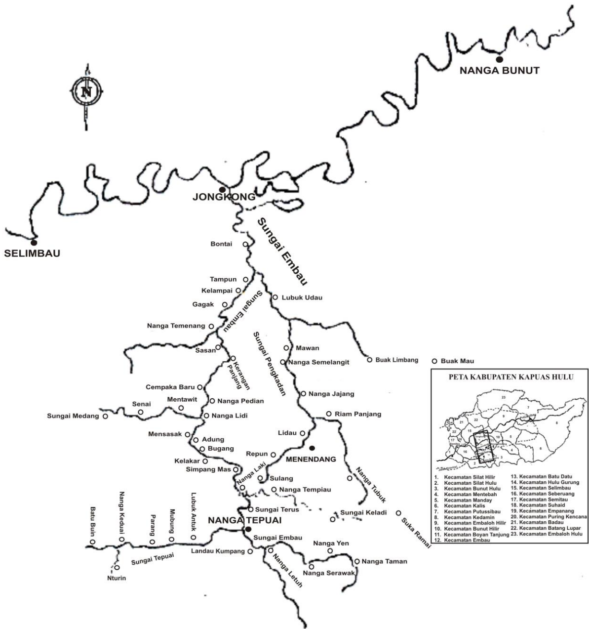
Peta 2.1 Kawasan Embau